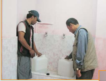
प्रशोधित पानी संकलन