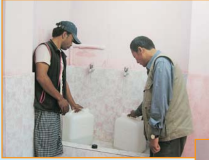
प्रशोधित पानी संकलन